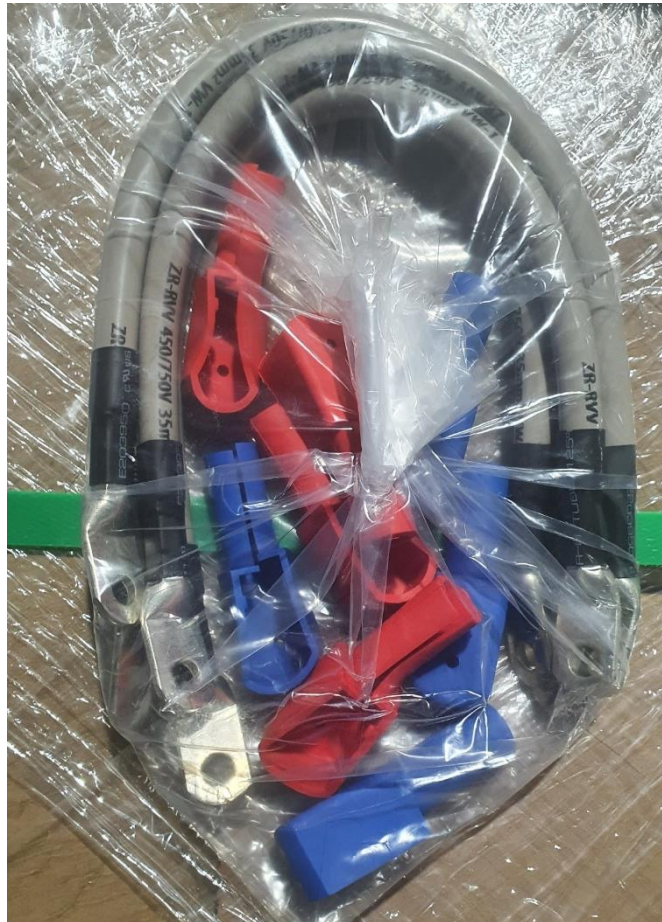
Ilustración 2: Detalle de los cables de conexión y cubiertas de bornes.