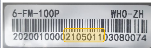
Ilustración 3: Detalle de etiquetas de la batería con fechas de fabricación, carga e inspección en fábrica.