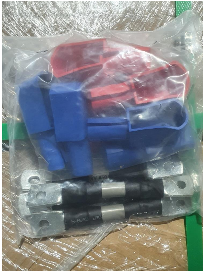
Ilustración 2: Detalle de los cables de conexión y cubiertas de bornes.