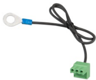
Conector con el cable negativo de CC preensamblado (incluido)

Protege la batería de las descargas excesivas y puede usarse como interruptor de encendido/apagado del sistema El Smart BatteryProtect desconecta las cargas no esenciales de la batería antes de que se descargue completamente (lo que dañaría la batería) o antes de que se quede sin la carga suficiente como para arrancar el motor. La entrada de encendido/apagado puede usarse como interruptor de encendido/apagado del sistema.